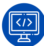
Jasa terkait Komputer