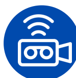
Jasa Audio Visual