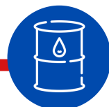
Lubricating Base Oils

Contoh Produk Indonesia yang Tarifnya Dieliminasi oleh Korea